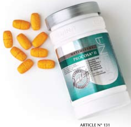
ARTICLE N° 131

L'activité physique, comme la marche, le fait de soulever des charges ou de taper au clavier, soumet nos articulations à un stress énorme chaque jour. Même si nous traitons constamment nos articulations sans ménagement, nous tenons pour acquis qu'elles nous dureront sans aucun problème pendant des années. Pourtant, des millions d'Américains et de Canadiens souffrent d'un problème articulaire. La situation est pire chez les athlètes et chez les personnes soumises à un stress physique intense, à la maison ou au travail. Pour favoriser la santé des articulations, USANA a créé PROCOSA MD II, un mélange de glucosamine, de manganèse, de vitamine C et de silicium, les piliers d'un cartilage en santé.